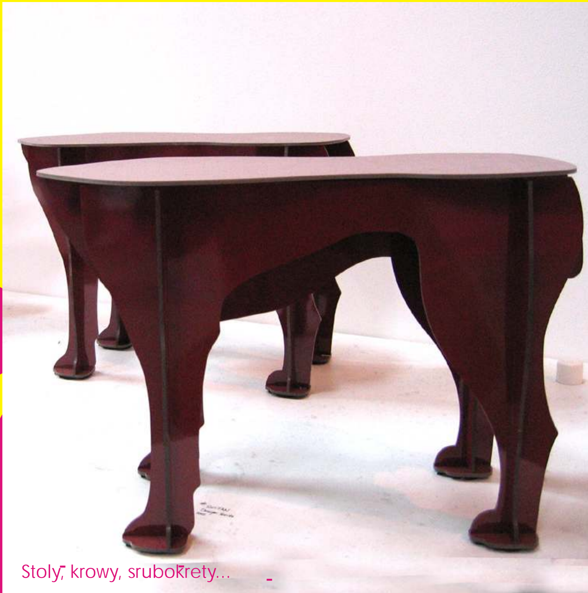
Stoly, krowy, srubokrety...