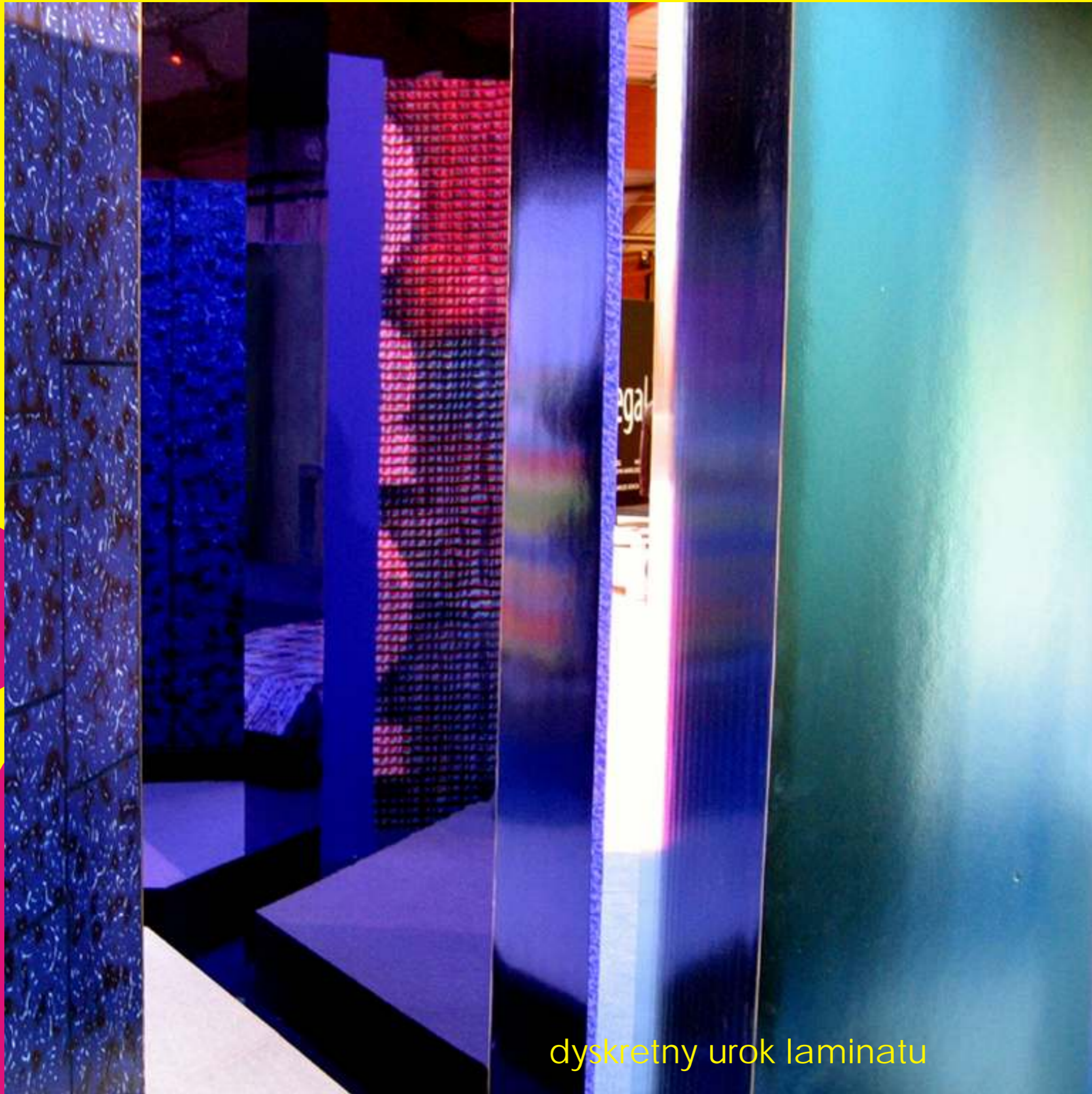
dyskretny urok laminatu